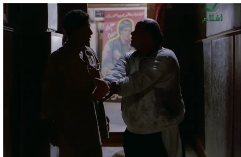
الكابتن وصلاح فى ظل بروس لى ، وفى نور الراقصة